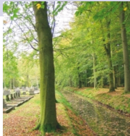
Sloten rondom begraafplaatsen, zoals hier bij de oude Noorderbegraafplaats in Assen, dienden eenvoudigweg als drainage